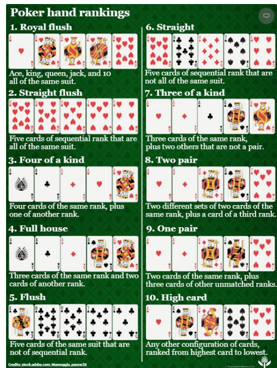
Gambar 2. Poker Hand Rankings, diambil dari [4]